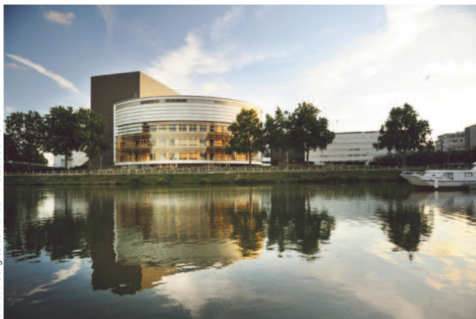
Cité des Congrès de Nantes - © StudioGarnier

Sur ce qui doit être recherché pour évaluer les besoins de l'enfant et selon quels critères en fonction des contextes.